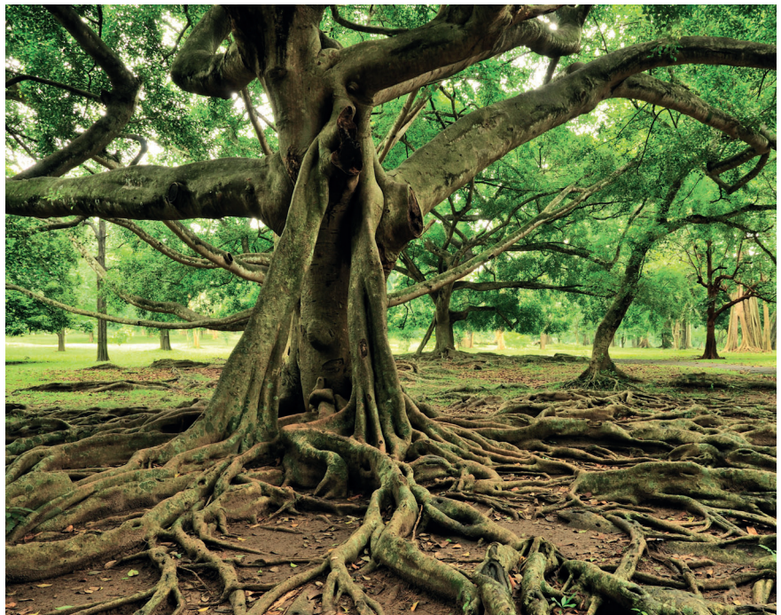
Das St. Galler Coaching Modell (SCM) ® ermöglicht es, Systeme und ihre Verstrickungen sichtbar zu machen, wie z.B. Konflikte und Dynamiken im familiären, partnerschaftlichen oder beruflichen Kontext.

Bei der Frage, was Menschen vermissen oder wovon sie gerne mehr hätten, werden nicht selten «Selbst-Themen»