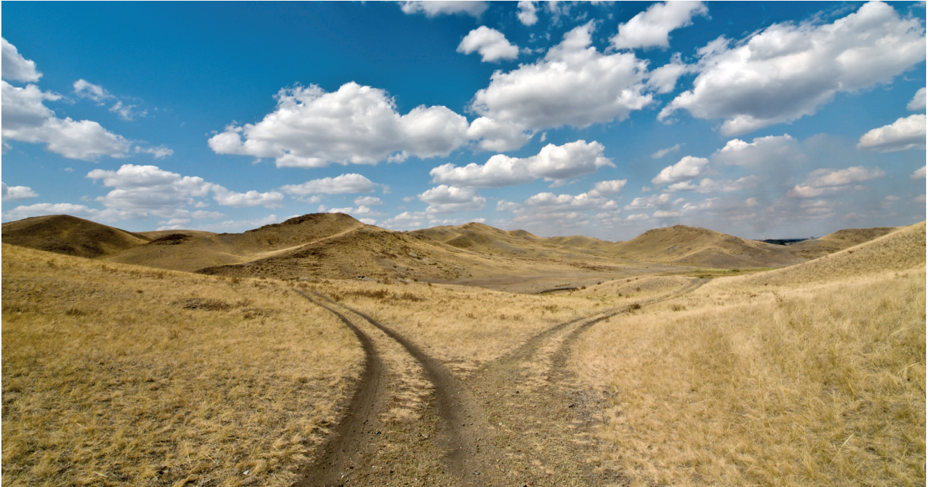
Entscheidungsblockaden lösen und wieder vermehrt auf das eigene Bauchgefühl vertrauen.